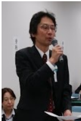
発言する 大利書記長

ただ働き一掃を運動方針に。 昨年は大塚、広尾に労働基準監督署の指導が入っています。その前には松沢、墨東、豊島に労基署の指導が入っています。このように毎年病院支部の分会のある病院に労基署が調査・指導に入り、ずさんな労働時間管理の在り方を厳しく問題にしています。大塚分会の組合員は昨年4月から9月まで6か月分の労働時間をデータの山をひっくり返して記入するように求められました。管理職がずさんな労働時間の管理を行った、その尻拭いをさせられたわけです。労基署が現認している通り都立病院には明らかな労働基準法違反のただ働きが存在しています。多くの組合員がただ働きに苦しめられています。組合員が一番苦しんでいる問題と闘わない組合に存在意義はありません。