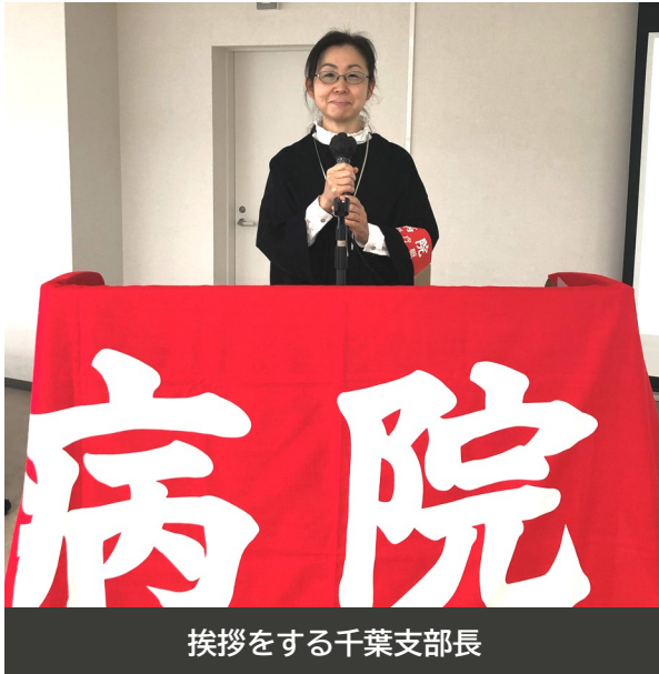
挨拶をする千葉支部長

10月30日（金）病院支部は第60回定期大会を文京区民センターで行いました。活発の議論が行われ、都立・公社病院の独法化を許さない運動方針・予算案が可決・成立しました。