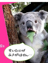
空いた口が寂しがりやさん...

5月1日のツイッターデモ用のバナーです。支部HPからダウンロードできます。ツイートに貼り付けて、このバナーも拡散させましょう。