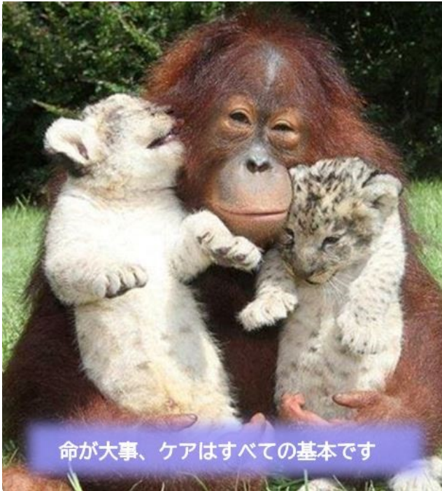
命が大事、ケアはすべての基本です

私たちの職場の独法化が今回の都議選にかかっています。選挙に行っても何も変わらないと思っているかもしれませんが、しかし政治は遠いものではなく、私たちの生活に直接影響を与えます。第4波で大阪の死亡率が異常に高かったのは、大阪の政治が住民の命と健康を守るという基本を欠いていたからです。このように政治は私たちやその家族の命まで左右するのです。今、このタイミングでオリ・パラを強行すれば感染拡大は避けられません。感染が広がれば必ず命が失われます。「優秀な医療人材を確保するために独法化する」という意見があります。育てるのではなく「確保」なのです。人件費を人への投資ではなくコストとしか見ない独法化は人を育てることができないのです。命が失われるのがわかっていながら、あえて行う。都議選でこんな命を粗末にする政治